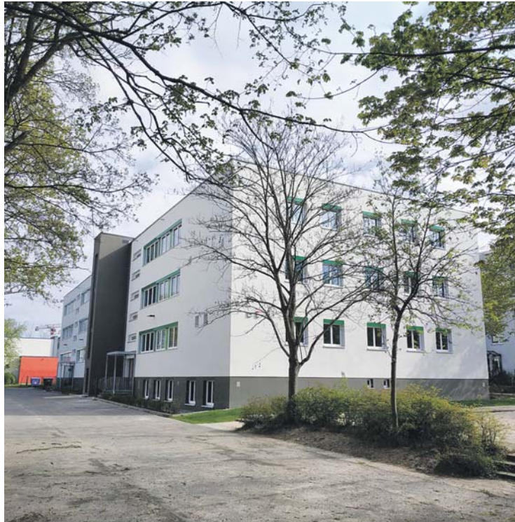
Die sanierte Wolfgang-Amadeus-Mozart-Gemeinschaftsschule in Hellersdorf

Nachdem die Kiekemal-Grundschule in Mahlsdorf im April diesen Jahres endlich eine Erweiterung auf dem Lehnitzplatz bekommen hat, müssen nun auch die Erweiterungsmaßnahmen für die anderen Grundschulen im Bezirk vorangehen. Bis zum Frühjahr 2023 soll eine neue Grundschule am Naumburger Ring in Hellersdorf entstehen. Die Grundschule an der Mühle soll nach aktuellem Zeitplan bis Ende des Jahres 2021 Schulpavillons im Rahmen des Pilotprojektes aus Charlottenburg-Wilmersdorf erhalten. Bis Mitte 2022 sollen die Schulcontainer für die Kolibri-Grundschule auf ei-