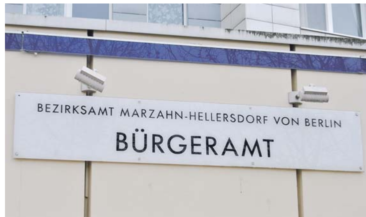
Auch die frühere Schließung von Bürgerämtern hat die Situation verschärft

Der Bearbeitungsstau bei den Wohngeldanträgen und den WBS dauert mittlerweile schon viele Monate an. Trotz einer angespannten Personalsituation im Bereich der Bürgerdienste sind die rechtlichen Rahmenbedingungen endlich umzusetzen. Gerade in der heutigen Zeit sind die Möglichkeiten für Familien mit geringem Einkommen, die nach bezahlbarem Wohnraum auf dem schwierigen Wohnungsmarkt suchen, begrenzt. Durch einen WBS kann dieses niedrige Einkommen nachgewiesen werden