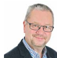
Klaus-Jürgen Dahler Sprecher für Haushalt, Personal und Bürgerdienste

oder Kurzarbeiter*innen durch die Pandemie Einkommenseinbußen hinnehmen mussten. Gerade sie sind auf die Unterstützung bei der Suche nach neuem Wohnraum angewiesen und können nicht monatelang auf die Bearbeitung ihrer Anträge warten.