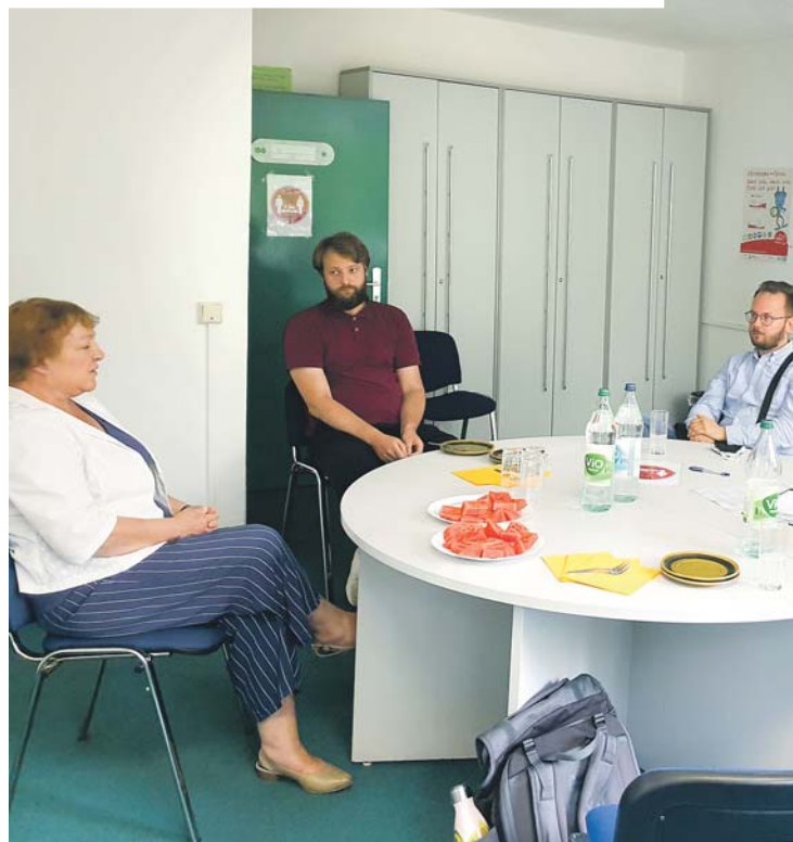
Zu Besuch bei der Schuldenberatung Julateg