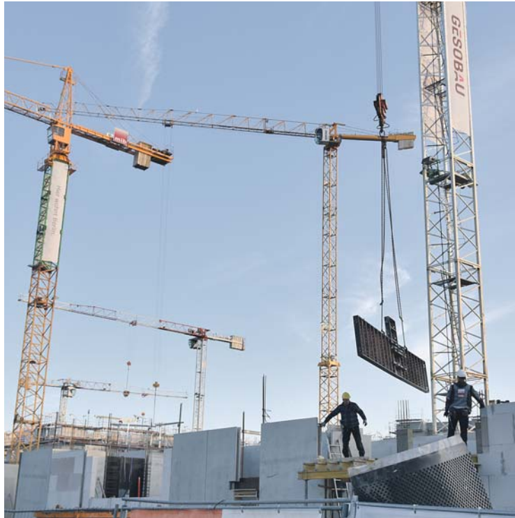
Bauarbeiten für das neue Gesobau-Quartier an der Zossener Straße

Wohnraum wird weiterhin gebraucht. Auch Grundstücke für z. B. Kitas und Schulen dürfen nicht fehlen.