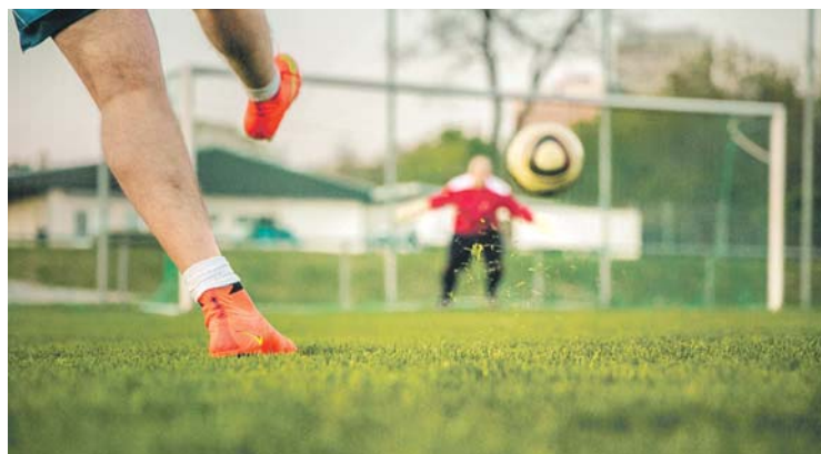
Unsere Sportvereine – vielfältige Möglichkeiten für Jung und Alt

Wir wollen nicht nur die Zukunft der Sportvereine sichern, sondern auch die Sportstätten zukunftsfähig gestalten. Hierfür soll beim Neubau oder der Sanierung von Sportstätten, Nebengebäuden und überdachten Sportplätzen auf Dachbegrünung oder den Einbau von Solarzellen gesetzt werden. Diese Kombination kommt nicht nur den sportlich aktiven Menschen im Bezirk zugute, sondern auch dem Klima. Fördermöglichkeiten gibt es beispielsweise über Zuschüsse vom Green-Lab-Roof-Projekt.