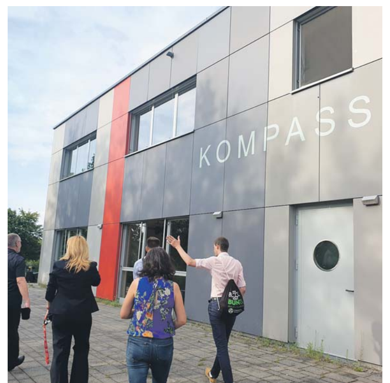
Der KOMPASS: Nachbarschaftszentrum in Hellersdorf

schaftszentren hinzu. Ein ganzes Haus in Bezirkseigentum gehört dort der Nachbarschaft. Unter einem Dach sind dort ein Stadtteilzentrum als auch ein Jugendklub zuhause. Und auch in Biesdorf am Balzerplatz gab es vor zehn Jahren die Idee, nicht nur eine Jugendfreizeiteinrichtung zu errichten, sondern auch einen Ort für Nachbarinnen und Nachbarn aller Altersgruppen aufzubauen. Ob in Mahlsdorf-Süd oder Marzahn-NordWest – die Idee heißt vielfältige Bürgerhäuser mit Angeboten von Bibliothek über Jugendklub bis Mieterberatung zu etablieren. Unter einem Dach werden viele wichtige soziale, kulturelle und zivilgesellschaftliche Einrichtungen gebündelt. Dadurch, dass mehrere Einrichtungen sich ein Gebäude teilen, kann eine langfristige Finanzierung gesichert werden und auch die Häuser selbst bieten oftmals mehr Möglichkeiten.