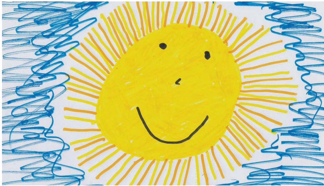
In diesen Zeiten ist es besonders wichtig, Kinderrechte zu stärken.